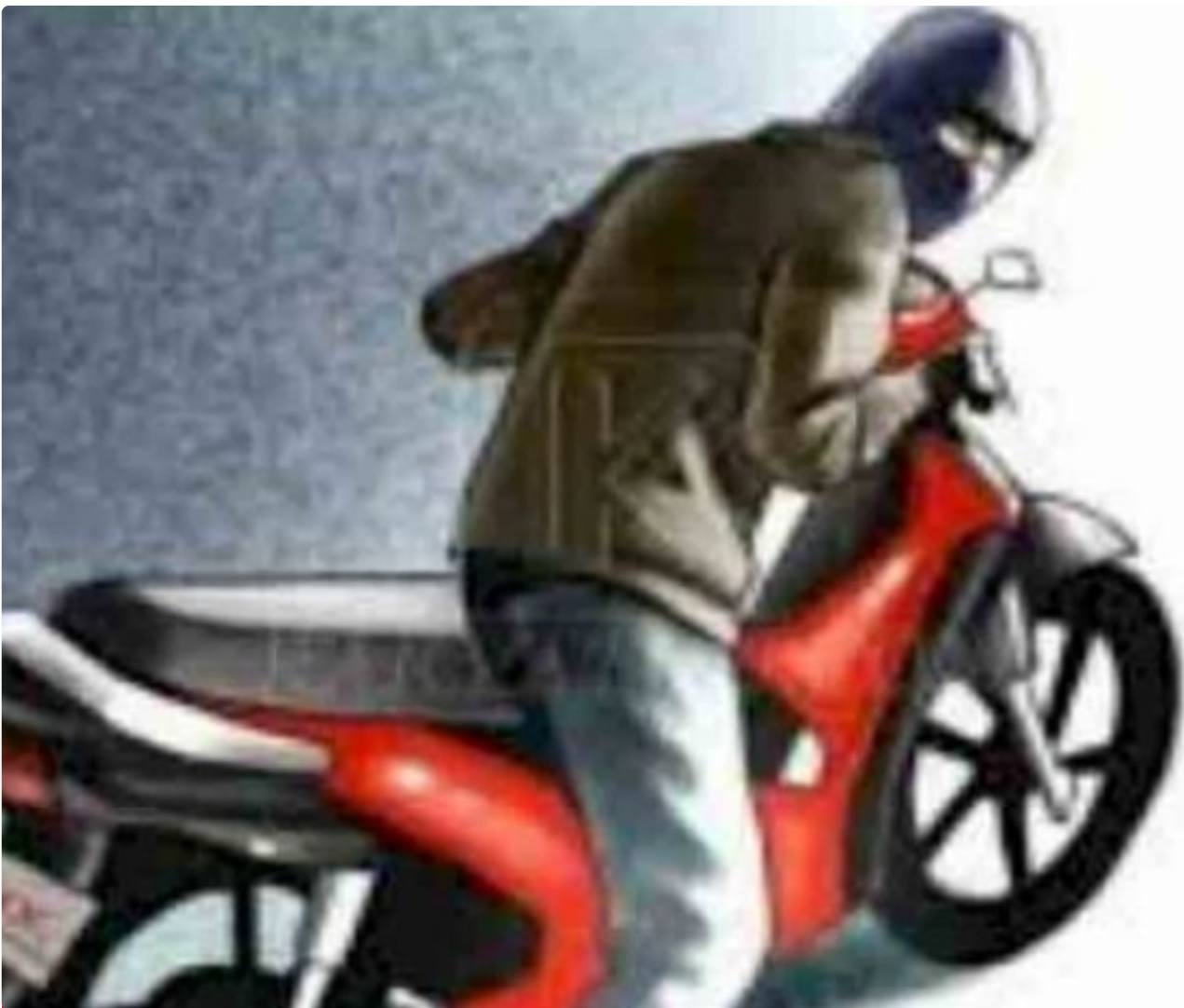
Gambar, Ilustrasi Depkoleptor Rampas Motor Konsumen Dengan Paksa

PALANGKA RAYA - Pemberitahuan bagi masyarakat Kalimantan Tengah,